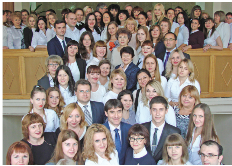
Сегодня на федеральной государственной гражданской службе в Управлении Федерального казначейства по Республике Крым состоит 455 казначеев.

Для разгрузки казначейств по ходатайству правящего Таврического губернатора в 1843 году открываются: Ялтинское и Евпаторийское уездные казначейства. А с 1853 по 1855 годы на территории крымского полуострова шли военные действия. Во время Крымской войны «по случаю опасности от неприятеля» Ялтинское казначейство было переведено в Симферополь и вместе с Симферопольским казначейством переезжало из до-