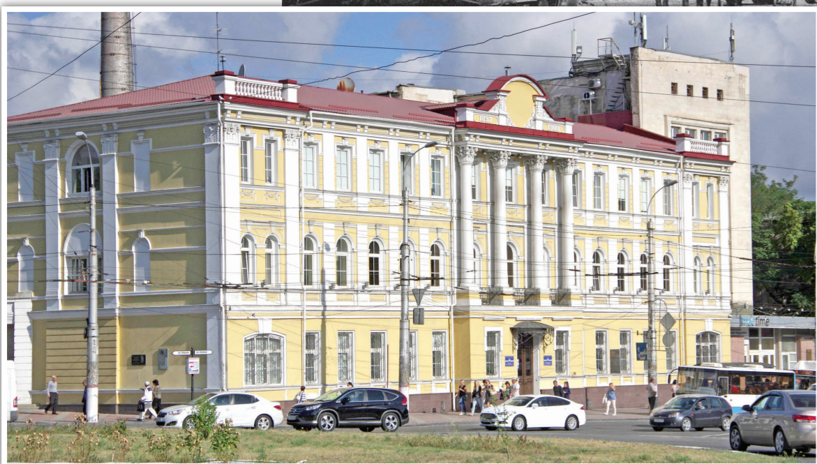
Сегодня здание бывшей Казённой палаты (ныне административный корпус ГУП «Черноморнефтегаз», пр. Кирова, 52) является объектом культурного наследия регионального значения.